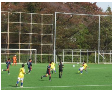
もう一つのサッカー選手権（東京予選突破）