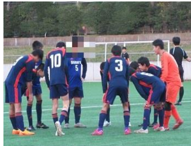
FID サッカー大会（準優勝）