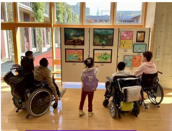
美術部の作品を鑑賞の様子