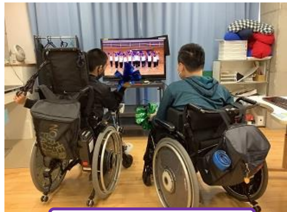
ミュージカル部のチアの発表の様子