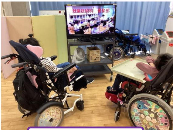
音楽部の演奏の発表の様子

11月4日（金）、5日（土）に肢体不自由教育部門における文化祭が行われました。就業技術科からはミュージカル部と音楽部の動画発表、美術部の作品展示、食品加工コースの焼き菓子の提供を通じて、コロナ禍における交流を工夫し、肢体不自由教育部門の児童・生徒に喜んでもらいました。