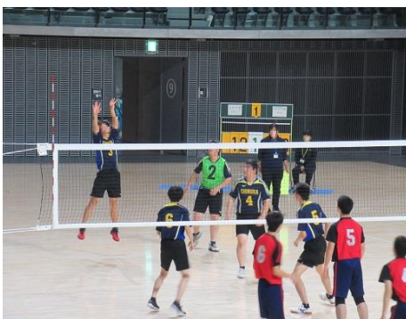
特体連バレーボール大会（男子）