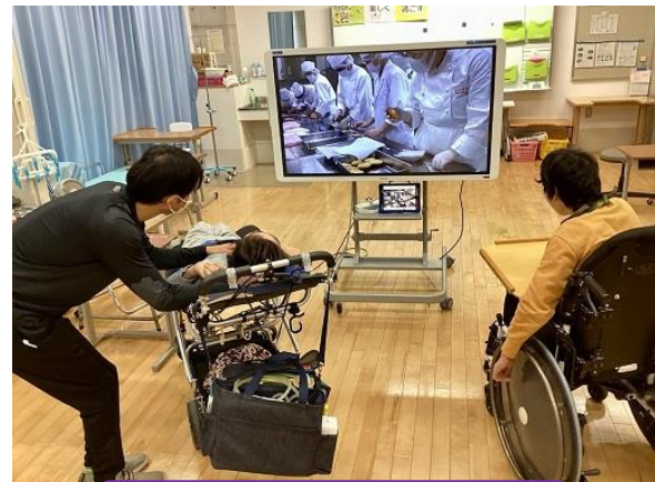
焼き菓子を作る食品加工の様子