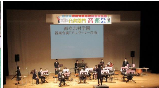
総合文化祭 音楽会合奏の様子