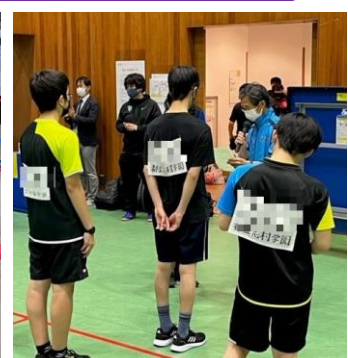
卓球交流大会表彰の様子