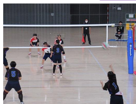
特体連バレーボール大会（女子）